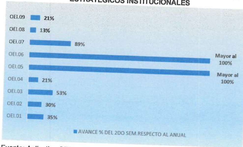
Gráfico N°01: AVANCE FÍSICO PORCENTUAL DE LOS OBJETIVOS ESTRATÉGICOS INSTITUCIONALES