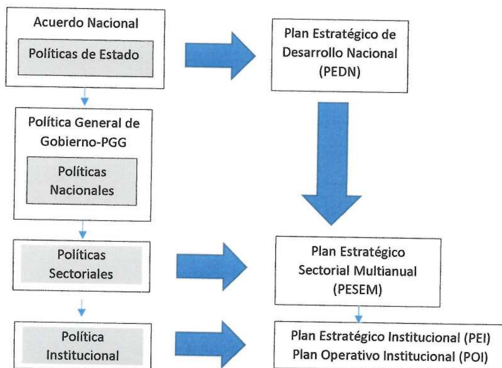
Gráfico 1: Articulación de políticas y planes en el SINAPLAN

Por último, en la cadena de resultados se aprecia cómo se relacionan todos estos instrumentos y como a partir de los bienes y servicios e inversiones (POI), se generan productos y resultados (PEI) a fin de implementar las Políticas Nacionales (Gráfico 2).