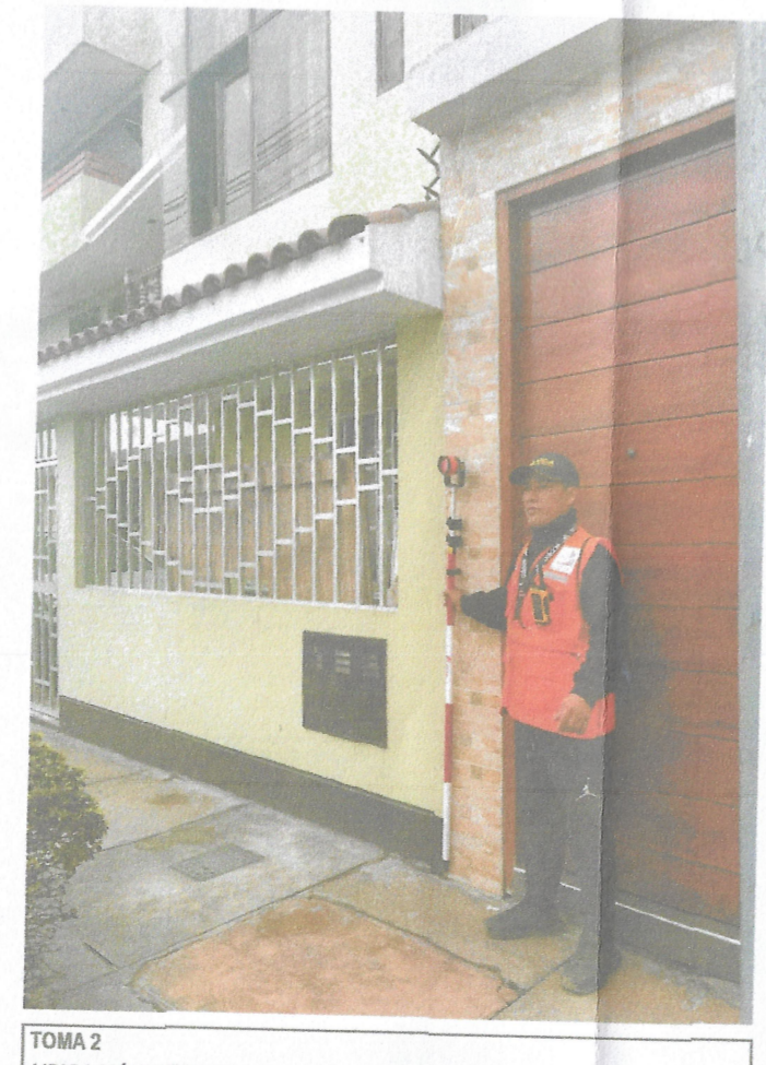
TOMA 2 UBICACION DE PRISMAS EN LIMITES DE VIVIENDA