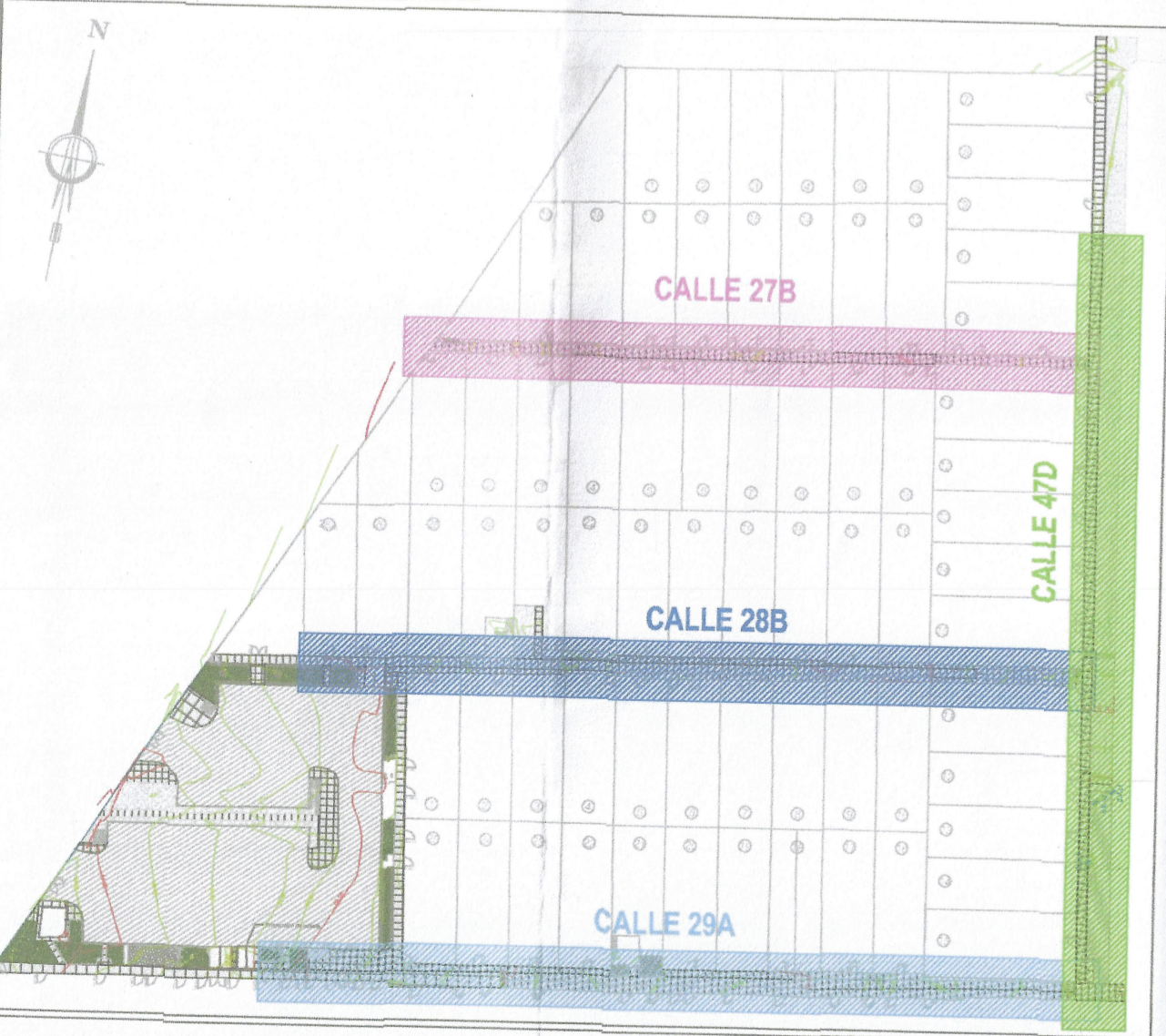
PLANO CLAVE ESC:1:1500