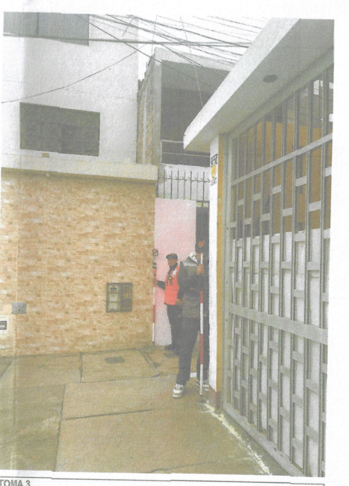
TOMA 3 UBICACION DE PRISMAS EN LIMITES DE VIVIENDA