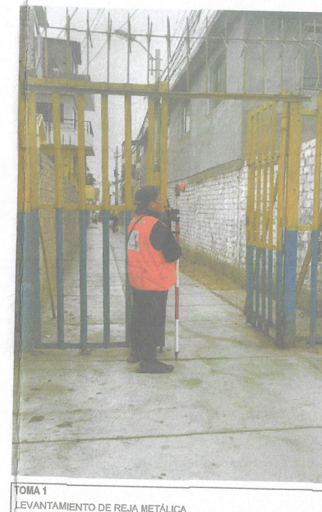
TOMA 1 LEVANTAMIENTO DE REJA METALICA