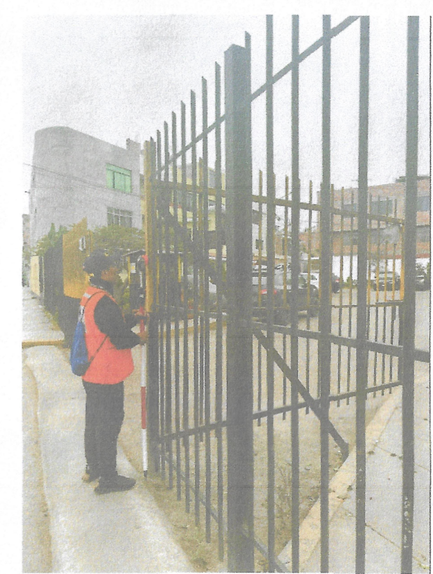
TOMA 4 TOMA DE PUNTO EN REJA METALICA