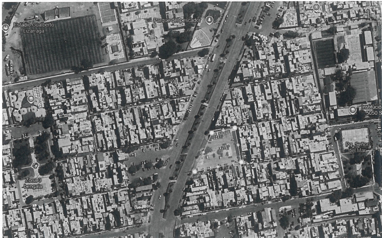
Imagen N°1: Ubicación del área a intervenir

Mediante el presente me dirijo a usted, a fin de solicitarle, se sirva remitirnos CONSTANCIA DE LIBRE DISPONIBILIDAD DEL TERRENO del área Comprometida para el proyecto de inversión Pública: "REMODELACIÓN FRENTE A CALLE 45-A Y LAS CALLES: 29-A, 28-B, 47-D, 28-H, 28-I, 300 EN LA URB. CIUDAD DEL PESCADOR-SECTOR 2 EN EL CENTRO POBLADO BELLAVISTA, DISTRITO DE BELLAVISTA, PROVINIA CONSTITUCIONAL DEL CALLAO, DEPARTAMENTO CALLAO" CUI 2686507, con el fin de proceder con las acciones preparatorias para el proceso de selección.